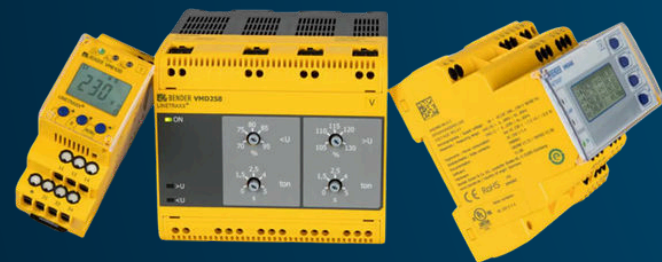
RELAIS DE PROTECTION