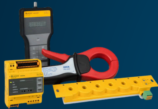
DÉTECTEURS DE DÉFAUTS À LA TERRE POUR LES SYSTÈMES NON MIS À LA TERRE