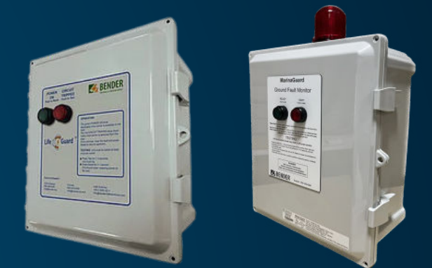
PANNEAUX DE PROTECTION