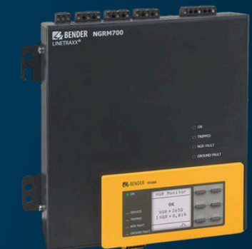
SYSTÈMES HRG ET LRG