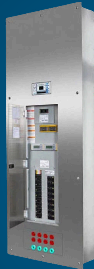
SYSTÈMES D'ALIMENTATION ISOLÉE POUR LES ÉTABLISSEMENTS DE SANTÉ