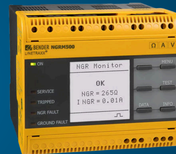
RELAIS DE MISE À LA TERRE POUR LES SYSTÈMES MIS À LA TERRE PAR RÉSISTANCE OU PAR MASSE