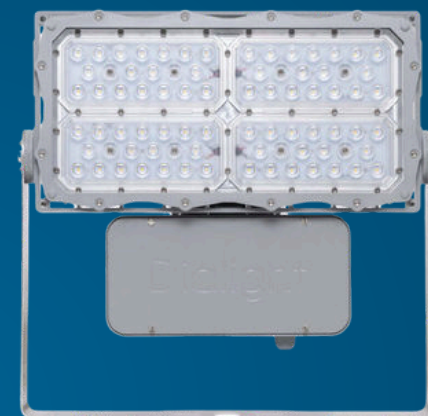
PROSITE™ EXPLOSION PROOF LIGHTING

Luminaires LED durables et étanches, adaptés aux environnements difficiles et explosifs.