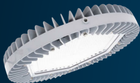
VIGILANT® HIGH BAY

Solutions d'éclairage haute performance pour grandes surfaces industrielles et entrepôts.