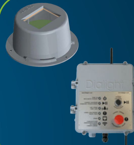
INTELLILED™ CONTROL SYSTEMS

Éclairage certifié pour zones à atmosphères explosibles (ATEX, IECEx).