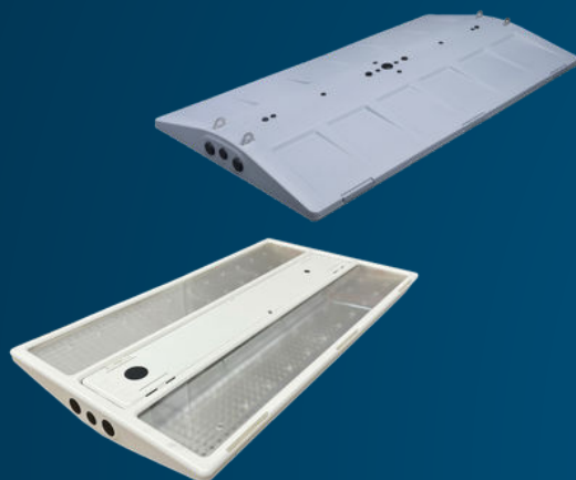
RELIANT™ AREA LIGHTS

Solutions d'éclairage haute performance pour grandes surfaces industrielles et entrepôts.